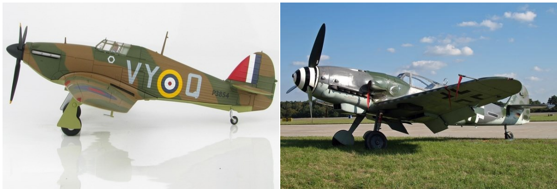
Britain Hawker Hurricane MKI

E poder y e bunitesa di un avion Spitfire por haci'e un favorito firme casi for di e momento cu el a bula pa prome biaha dia 5 di maart 1936. Pa ochenta aña, e Spitfire a keda un di e mas admira di tur e avionnan di guerra, pero e storia di su coneccion unico cu publico Britanico - kendenan a coba den nan saco pa paga pa su produccion - ta masha desconoci.